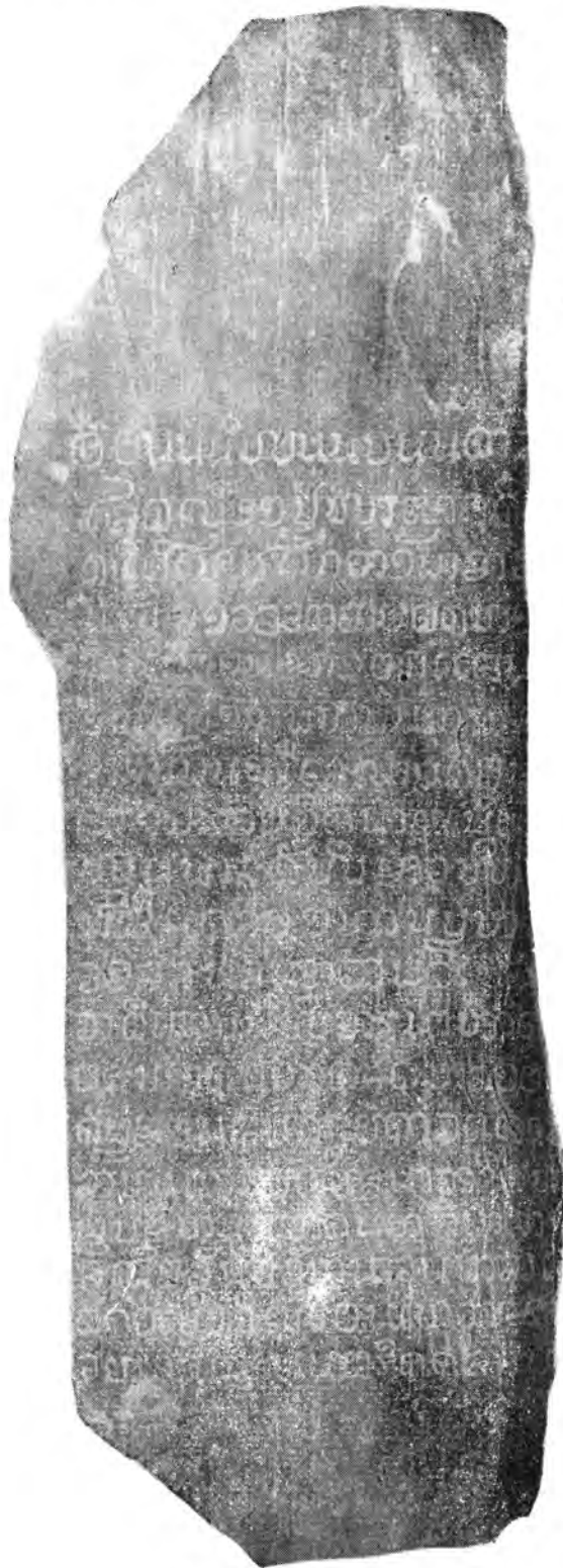
ด้านซ้าย ก่อนล่าง