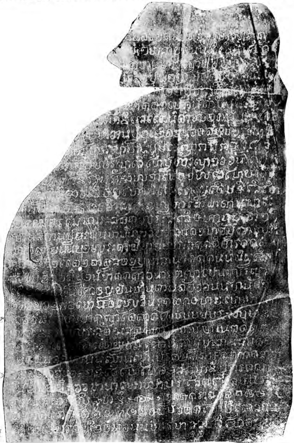
ศิลาจารึกซึ่งพบใหม่ ที่วัดพระมหาธาตุ ตำบลเมืองเก่า จังหวัดสุโขทัย ด้านหน้า ท่อนบน