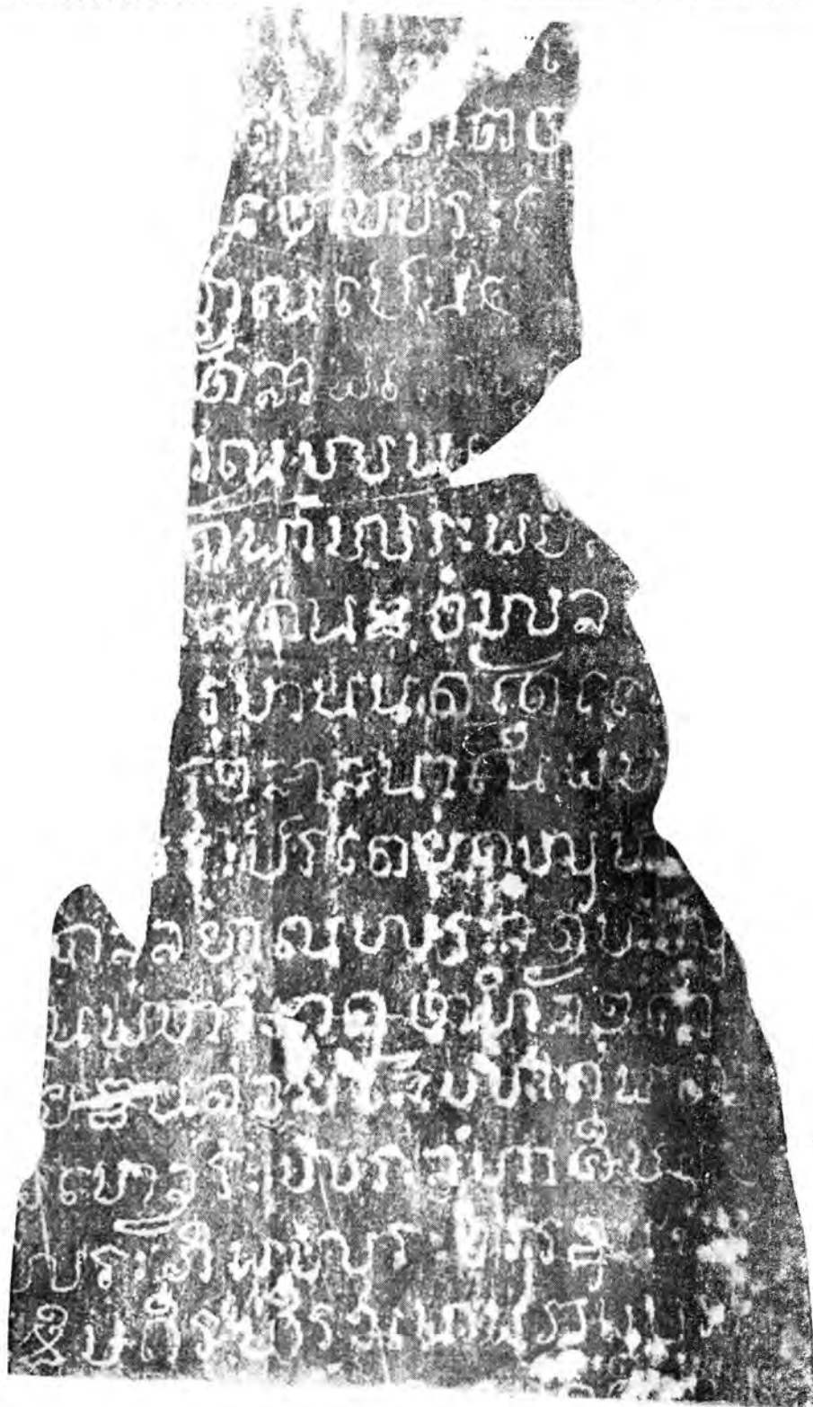
ด้านซ้าย ก่อนบน